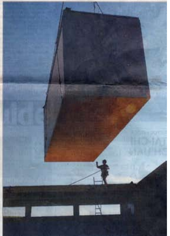
A l'aide d'une grue, chaque classe est directement déposée sur ses fondations. Une salle compte 72 m 2 .