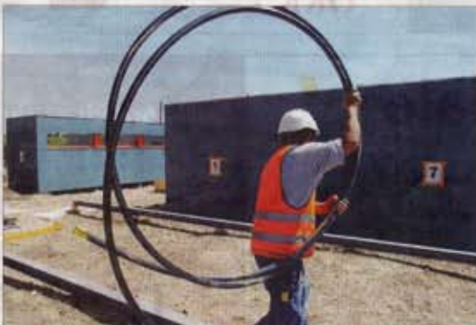
Il reste encore à raccorder les salles de classes à l'eau et à l'électricité. Tout sera prêt pour la rentrée scolaire prévue le 1 er septembre.