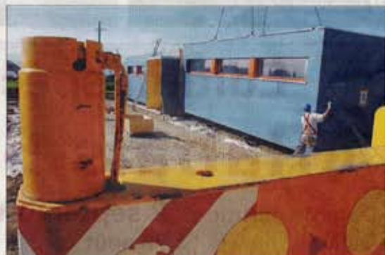
Les deux modules sont reliés par un couloir qui abritera des toilettes. Le transport des éléments de cette construction a nécessité la mobilisation de sept camions.