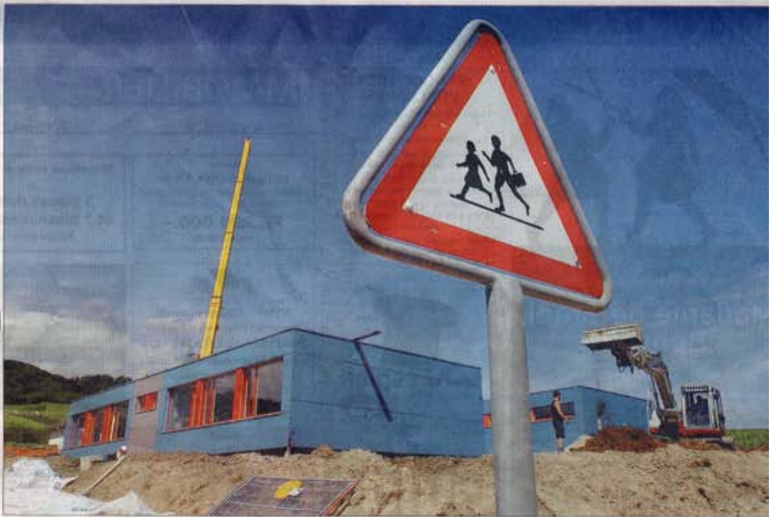
Deux des quatre pavillons préfabriqués en bois ont été posés, hier. A partir de septembre, les automobilistes devront être encore plus attentifs en passant près de l'école.