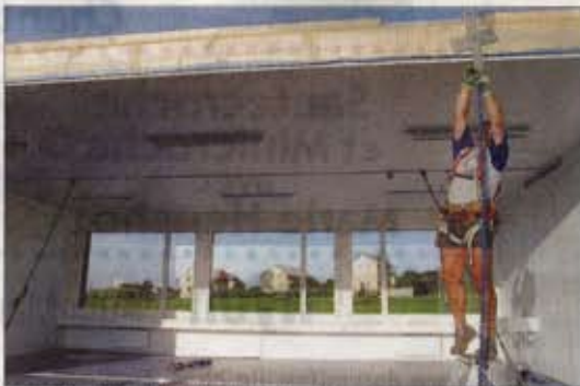
Le module, déjà équipé d'un lavabo et de radiateurs, est posé sur son socle. Les chaînes qui le relient à la grue sont décrochées.