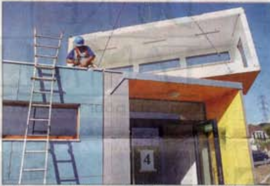
Peu à peu, comme un jeu de construction, les éléments sont assemblés les uns aux autres, avec une grande précision, par trois ouvriers seulement.

TEXTE: LAURIANE BARRAUD