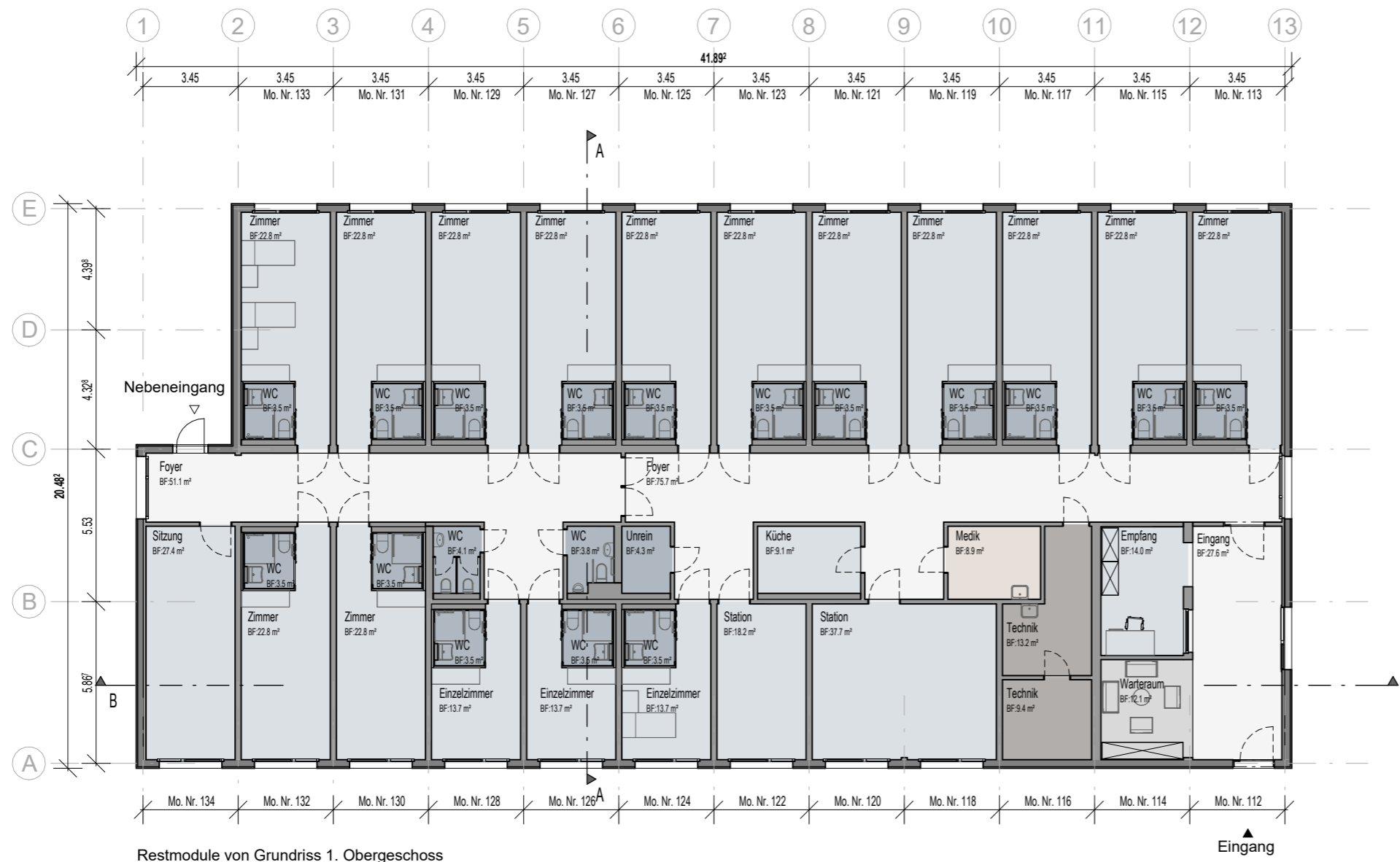
Restmodule von Grundriss 1. Obergeschoss