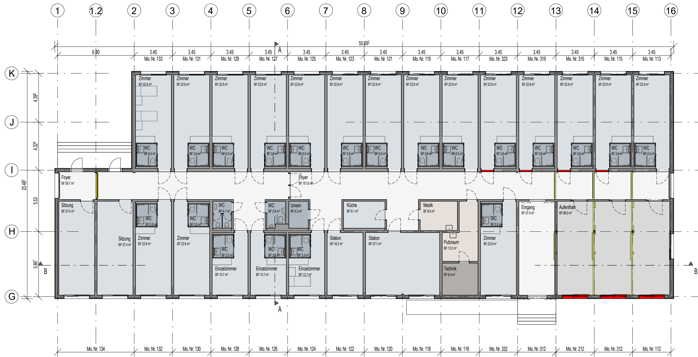
Restmodule von Grundriss 1. Obergeschoss