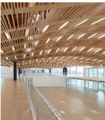
Andrea Diglas © by Arch-Tec-Lab AG